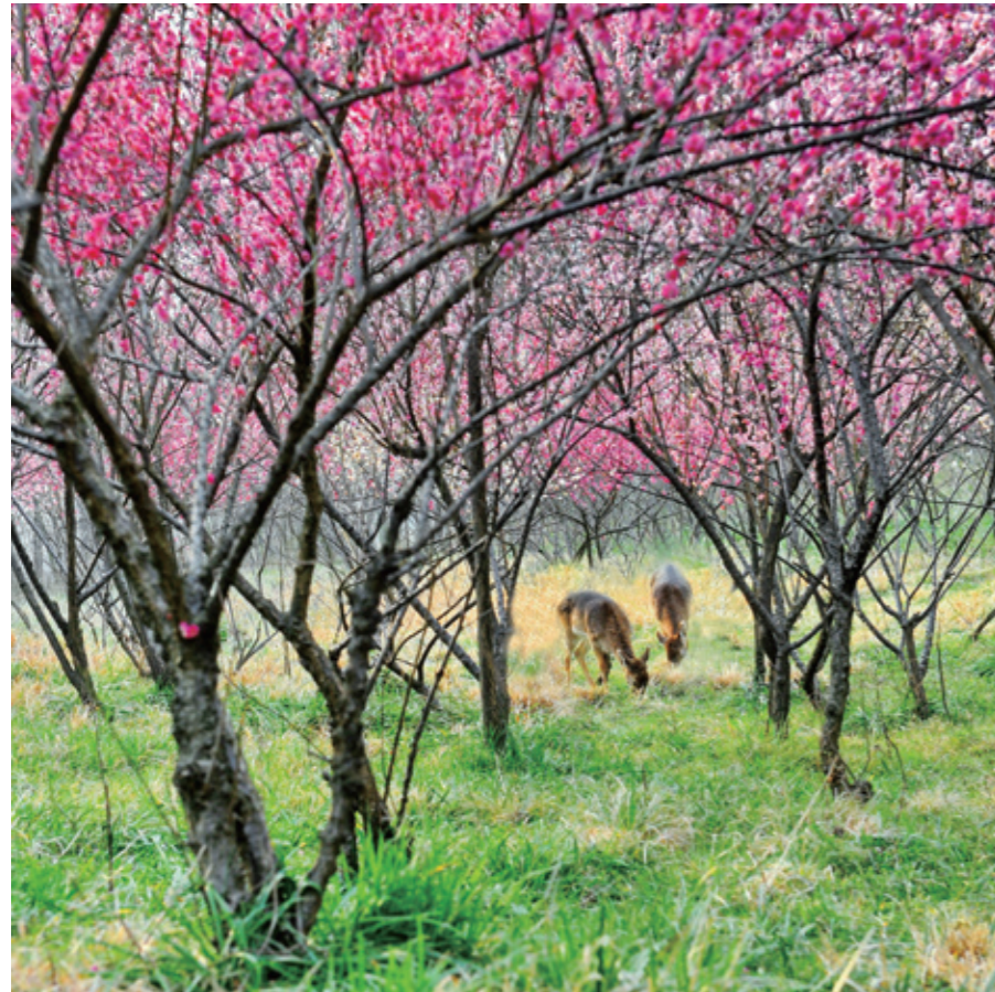
茱萸湾风景区扬州动物园