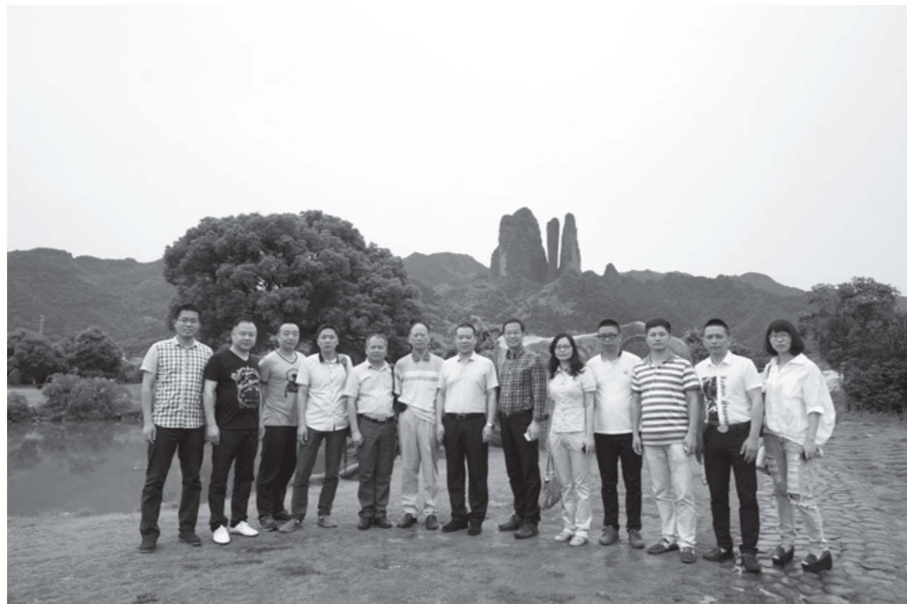
考察组于江郎山风景名胜区合影

通过外出学习考察，对照申报成功或正在申报待批的风景名胜区进行比较，单从大罗山风景资源禀赋来看，完全具备申报条件，且与外出考察的风景名胜区还具有一定的优势。近年来，对于大罗山申报国家级风景名胜