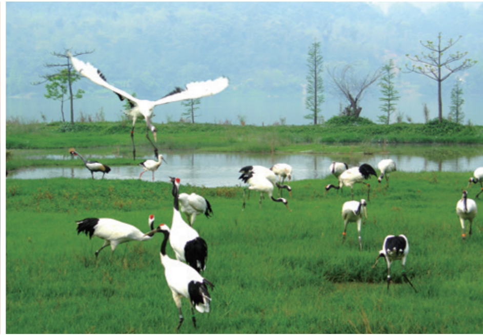
鹤舞翩翩