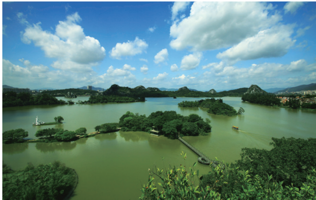
星湖湿地公园核心游览区：仙女湖全景图