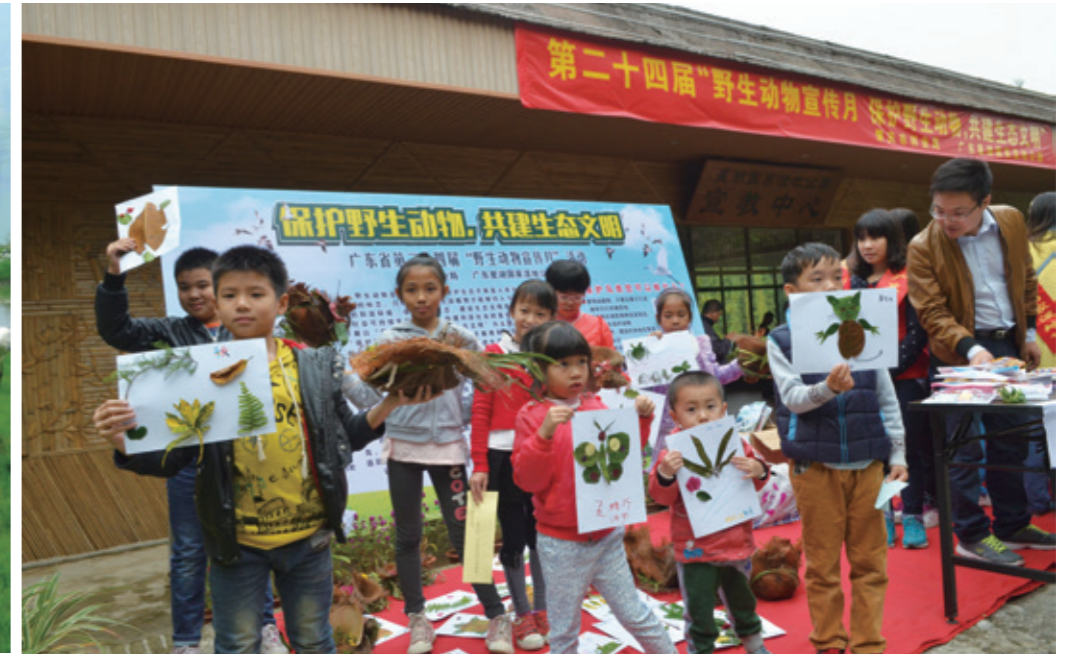
广东省第二十四届“野生动物宣传月”活动星湖湿地公园举行

据星湖管理局有关负责人透露，每年用于星湖环境保护的基础性投入资金在5000万元左右。通过系列截污、引水、排水等措施，星湖湿地650多公顷的湖泊水质，目前依然保持在地表水IV类标准。