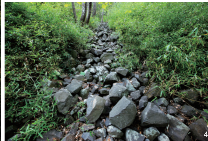
1 大美蜀山；2 竹海；3 蜀峰湾公园春色；4 火山岩流瀑布。