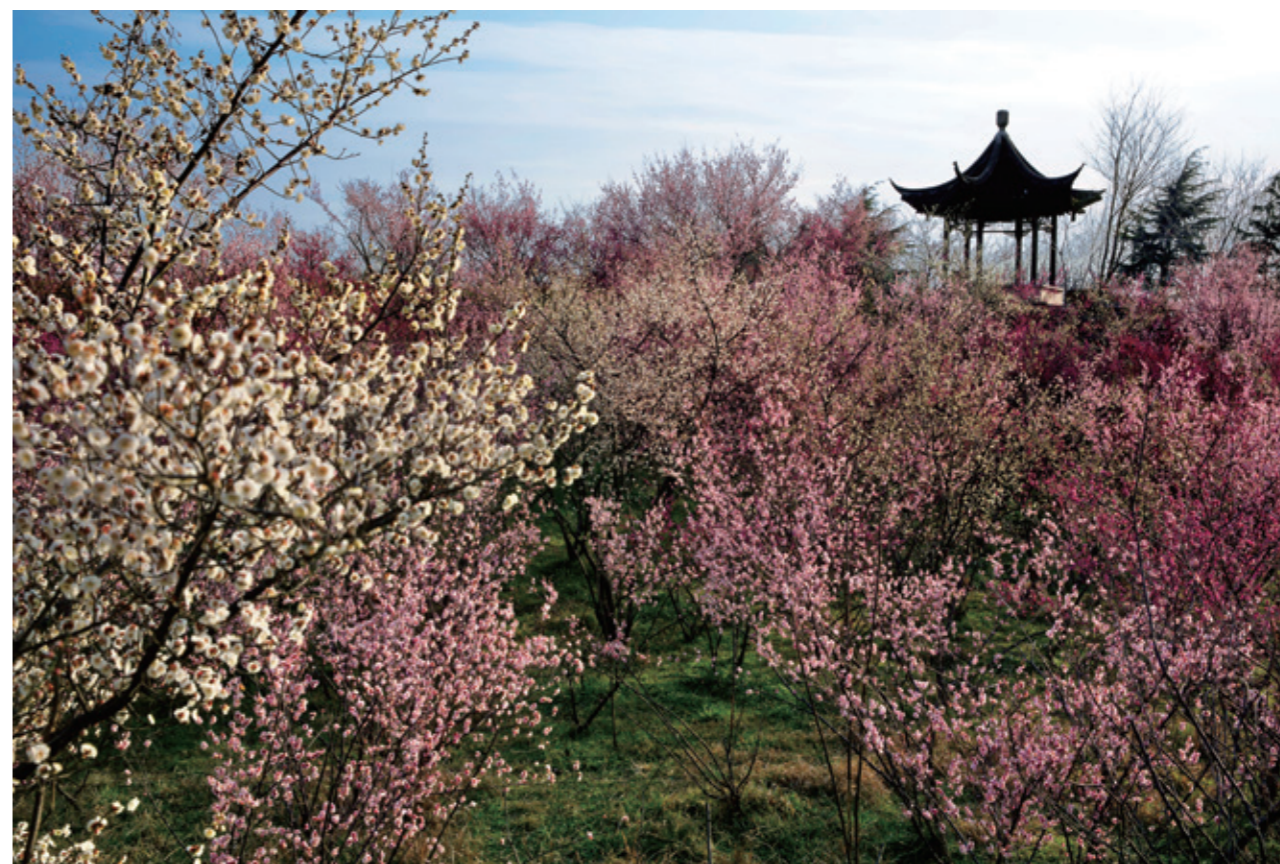
扬州茱萸湾风景区