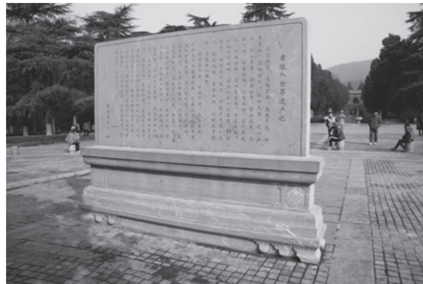
《孝陵入世界遗产记》石碑

明孝陵从下马坊至玄宫所在的宝城，纵深约2600米，沿线分布着30多处不同风格、用途各异的建筑物和石雕艺术。这些宝贵的文化遗产，历经600多年的沧桑，有的已经消失，有的损毁严重，仅存残垣断壁。明孝陵申报世界文化遗产时，承诺：按照申报世界文化遗产的要求，注意历史信息传递的真实性和文物不可