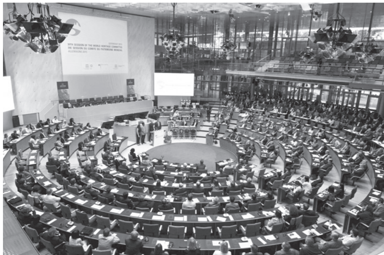
第39届世界遗产委员会会议现场

量的增长，申报和保护相关的工作成本逐渐上升到令WHC和咨询机构难以承受的地步。因此，以ICOMOS为首的咨询机构建议，限制缔约国申报数量，一年一国仅一项，且全球每年申报总数不超过25项（相关条款第61条）。同时，针对《操作指南》第68条，修订草案提出加入：“第三方缔约国可就预备名录中可能与已有遗产地冲突或处于国际争议地区的提名提出申诉，由WHC主席判断是否将该提名退回并要求缔约国说明”。此外，工作组还就上游程序、咨询、反应性监测等内容进行了讨论，涉及到如何加强缔约国和世界遗产中心、咨询机