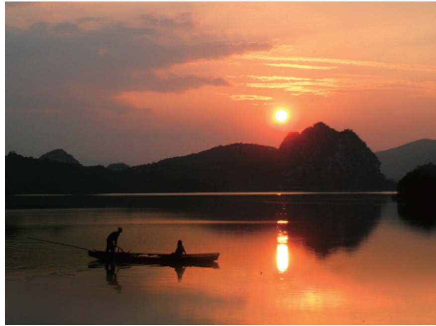
秋分前后的卧佛含丹气象奇观