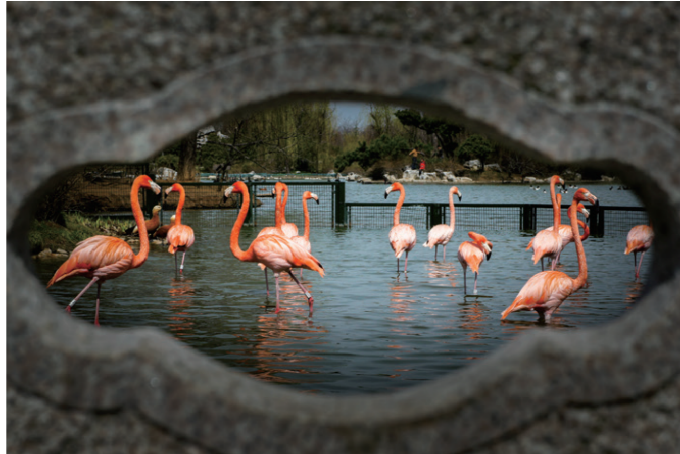
茱萸湾风景区扬州动物园