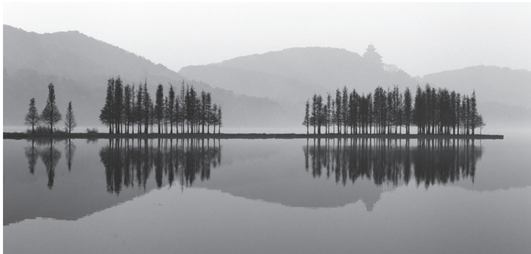
武汉东湖·落雁景区