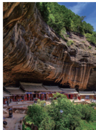
《麦积山·仙人崖初夏》

保护提出建议，涉及遗产委员会改革、发挥遗产的教育功能以及加强对发展中国家遗产保护管理的支持等多个方面。