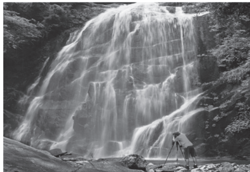
武功山水系景观——大王庙瀑布