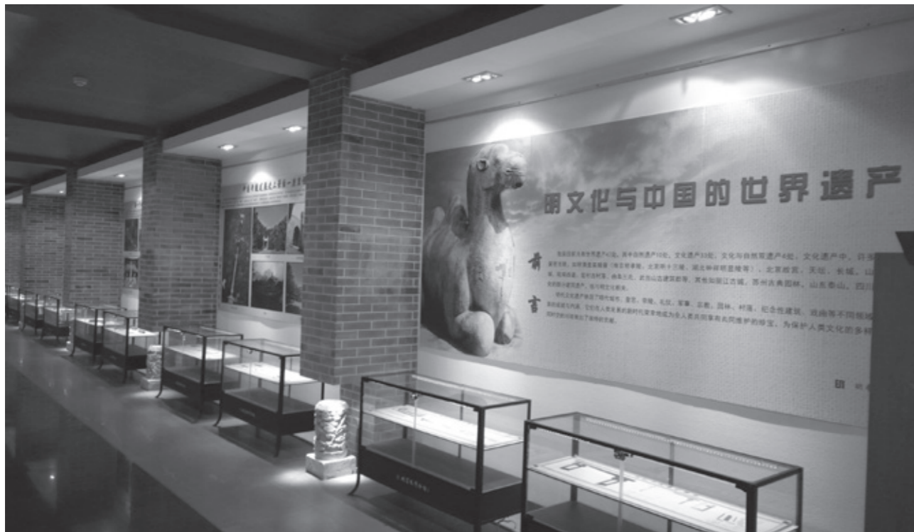
明孝陵博物馆内明文化月临时展览

孙权纪念馆观看3D电影《东吴大帝》，扫码关注“南京钟山风景名胜区”微信公众号，均可享受15元/人次的半价优惠。