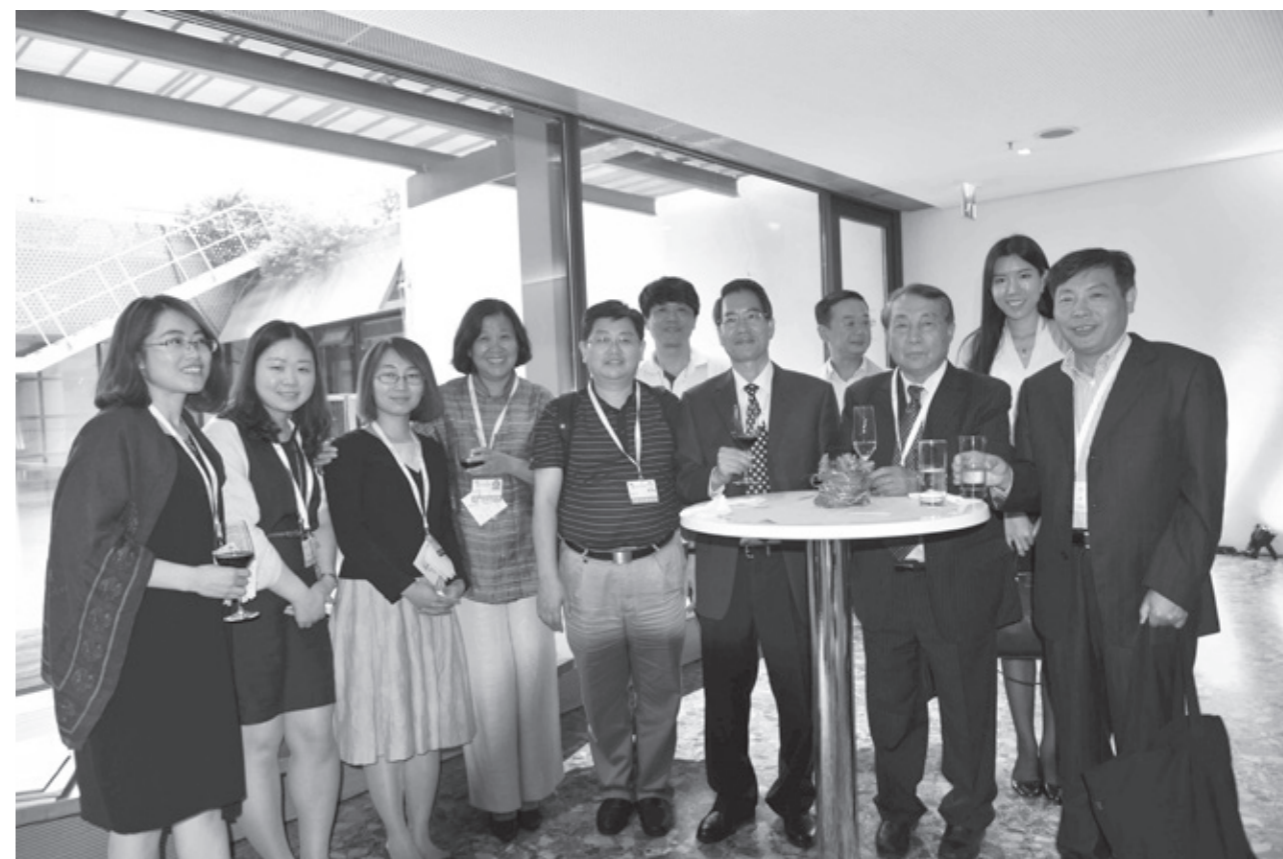
来自联合国教科文中国全委会、住建部、景区单位和风景协会的部分代表