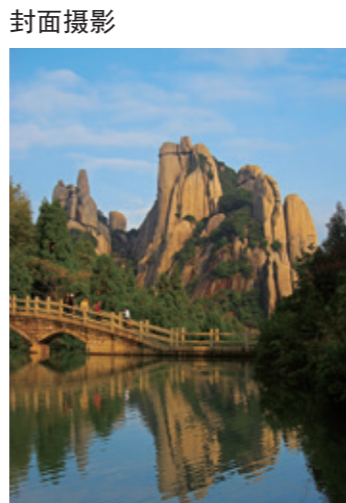
《太姥山·湖光山色》

一是加大设施外迁。实行“山上做减法、山下做加法”，实施办公、生活设施外迁工程，先后在景区外建设了客运集散中心、综合办公楼、职工生活小区等项目；成立洗涤中心和采购配送中心，实现“洗涤下山、净物