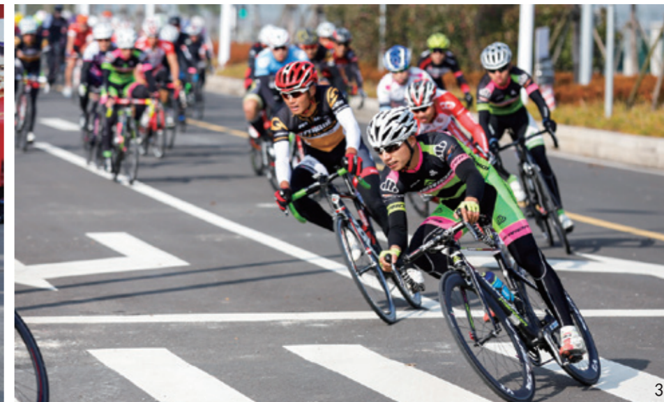
1 比赛出发门；2 中国自行车联赛总决赛上海崇明站开幕式现场；3 比赛中疾驰的选手们；4 崇明岛·北湖印象；5 瀛东村内绿荫环绕、鱼塘密布、自然环境优美、民风淳朴。