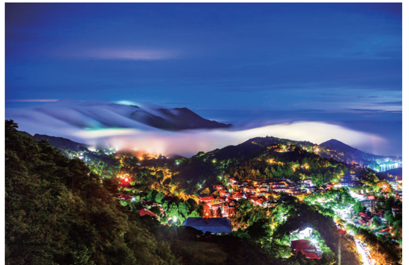
流光溢彩（二级收藏作品）