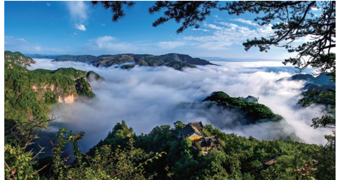
崆峒云海奇观（二级收藏作品）