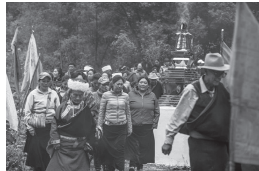
九寨沟日桑文化节

一是为社区居民提供基本生活保障。 从2000年起，我们每年按38万旅游人次计算提取沟内居民基本生活费；2005年后，以每年实际购票人数为基数，每张门票计提7元作为社区居民基本生活费；近五年，落实了景区居民基本生活费门票提取1.23亿元，同比“十一五”增加6436.56万元，人均达10万余元，增幅达109.74%。 二是增加社区居民收益分成。 近五年，在诺日朗服务中心经营项目中，按照居民占股49%、收益分成占77%比例，计提社区居民分红收益2713万元，人均达2.7万元。 三是为社区居民