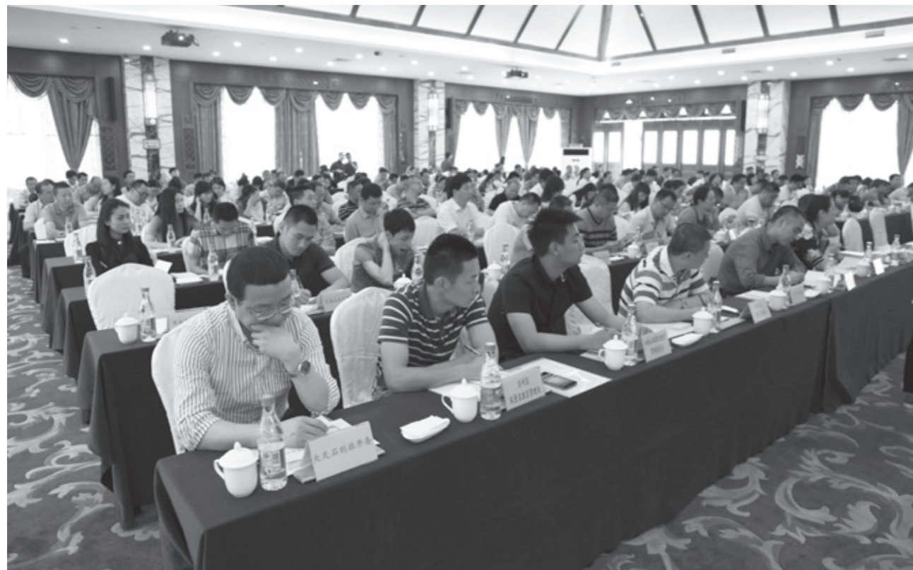
重庆市风景名胜区保护管理培训班

一步提高，景区基础设施日臻完善，旅游秩序更加规范，游客数量逐年上升，有着良好的发展势头，但是，在科学规划、统一管理、严格保护、永续利用上离住房和城乡建设部的要求还有一定的差距。自2012年住房和城乡建设部开展的执法检查4年来，武隆芙蓉江、江津四面山、南川金佛山等3个国家级风景名胜区被评定为优秀，得到了住房和城乡建设部高度评价和充分肯定，但是也有个别风景区连续两年检查为不达标，被列入了濒危名单。为了提升整体保护管理水平，我们加大了对管理相对滞后、保护力度削弱的风景名胜区整改力度，提高了当地政府对风景名胜区的保护意识，进一步理顺管理体制机制，积极推动风景名胜区科学规划编制工作，进一步规范了风景区日常管理，使风景资源保护管理步入正规化、法制化的良性循环轨道。