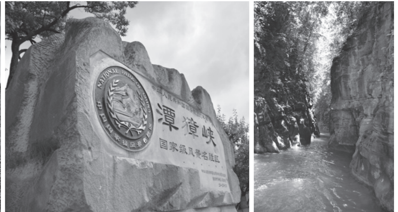
潭獐峡国家级风景名胜区徽志及景观