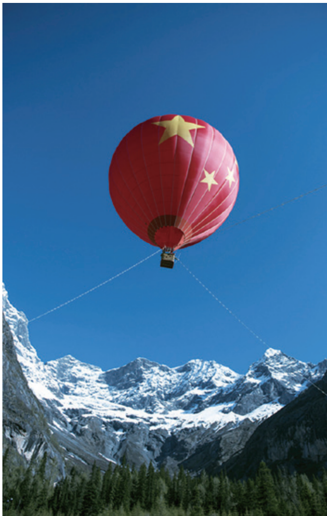
热气球在红杉林景点试飞