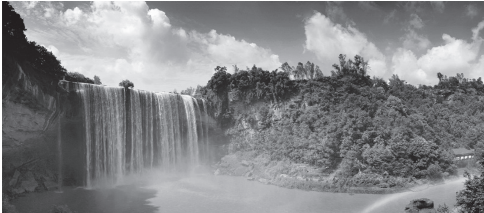
万州青龙瀑布市级风景名胜区