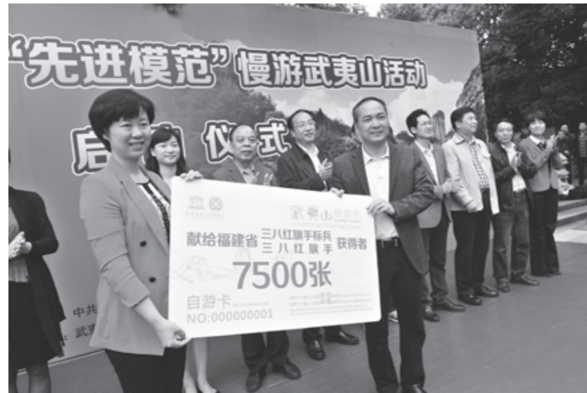
武夷山景区向福建省工、青、妇三个系统的省级以上劳动模范、先进人物赠送了价值1000余万元的21000余张慢游卡（年卡）

景区认真贯彻落实南平市政府“千亿旅游产业行动计划”，积极配合做好第二轮“一元门票游大武夷”活动（2014年11月20日-2015年4月20日）和“低碳之旅·畅游南平”活动（2015年12月1日-2016年3月31日）等工作，并以此为契机，强化服务理念，科学安排一线旅游生产，提升服务标准，得到广大游客的一致好评。