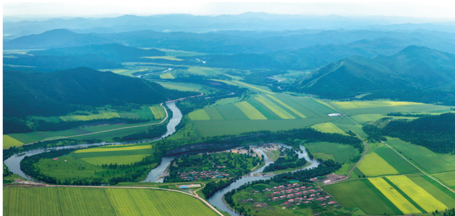
绰尔河十大湾