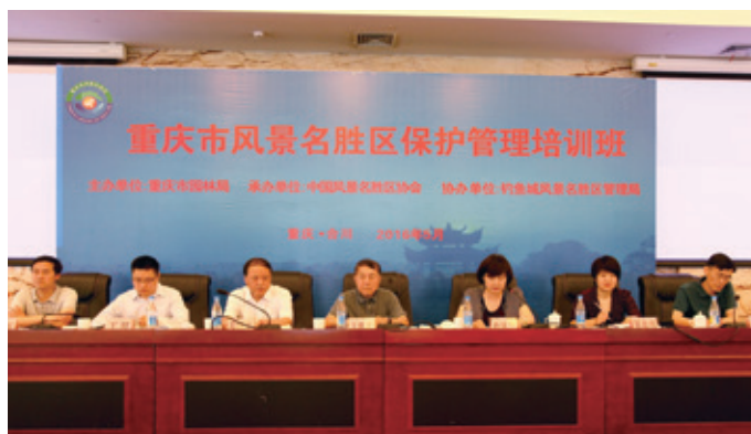
培训班开班仪式主席台