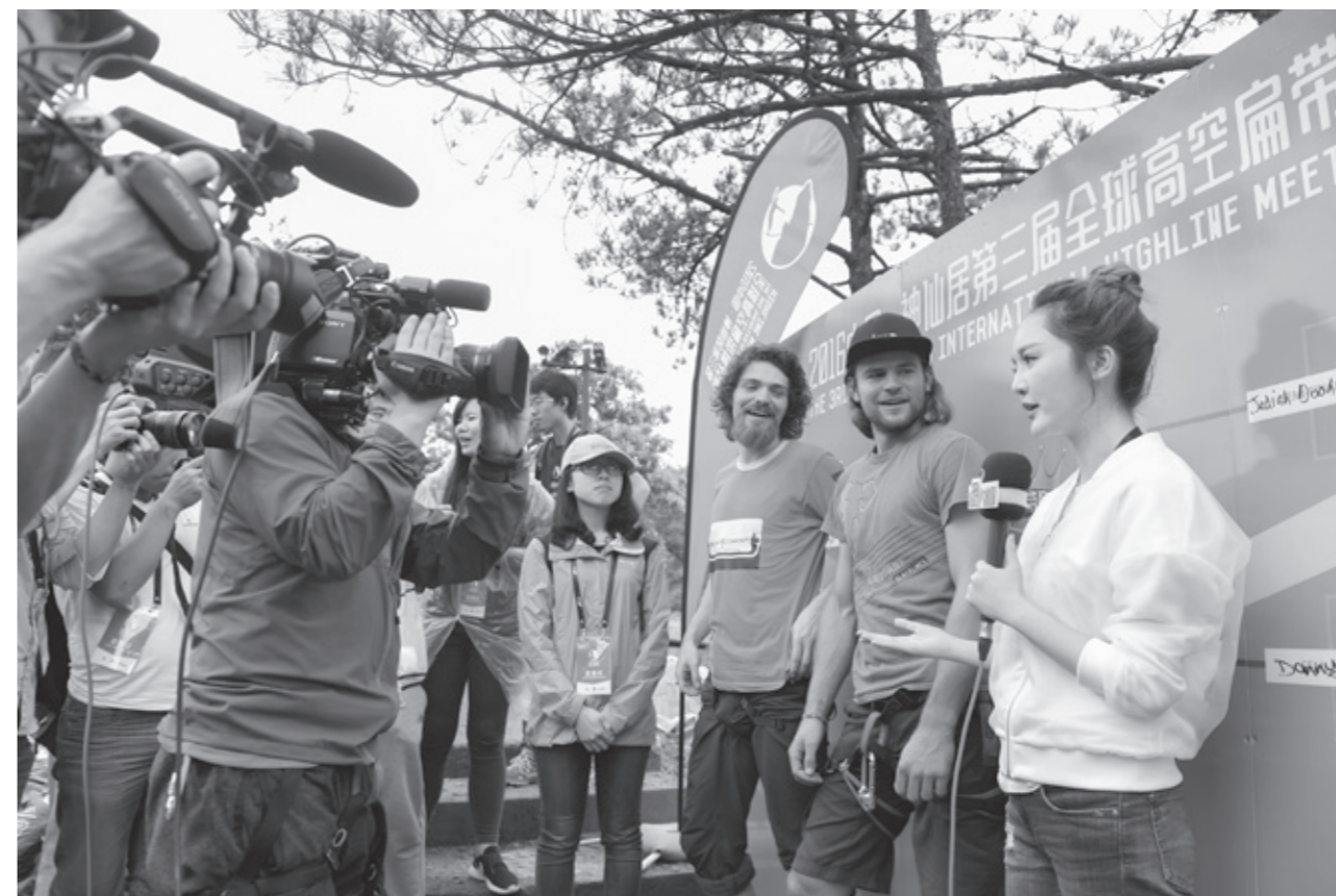
赛后采访