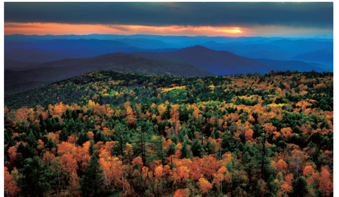
阿斯克德山林