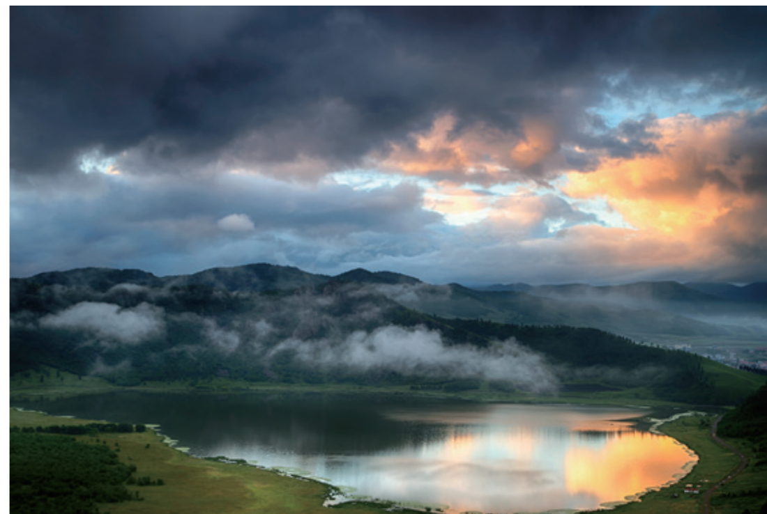
同心天池

师协会、黑龙江省高教学会摄影教育专委会已在小镇设立摄影创作基地；清华大学、内蒙古大学、内蒙古师范大学、内蒙古科技大学等20余所高校艺术学院在此建立写生基地，仅2005年以来，月亮小镇已累计接待写生师生1000余人次。