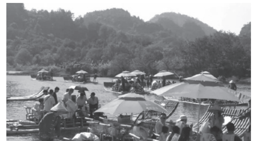
云河漂流

景区将2015年定为“旅游服务质量提升年”，着力从一线发出，提升管理服务水平，打造好精品景区，股份公司加强对一线旅游服务岗位的内部监督管理，及时发现存在的问题，推行立行立改措施，并明确责任人及整改期限，有力确保了有一项改一项、改一项成一项，全年出《旅游服务质量管理提升巡查整改落实情况通报》15期，发现问题150项，均已落实到位。云河漂流公司以五个“始终保持”为准则（始终保持积极向上的创业朝气；始终保持团结协作的工作精神；始终保持产品创新的发展意识；始终保持规范管理的严格制度；始终保持文明服务的强烈意识），营造创新发展、锐意进取的良好工作氛围，2015年公司接待游客和营业收入比2014年增长约90%，实现发展运营新突破；印象大红袍公司积极完善企业管理规章制度、细化措施，提升企业内部效能，同时以游客需求为