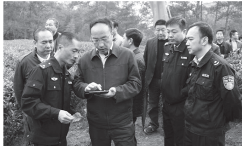
武夷山市委书记、景区党工委副书记马必钢在茶山操作GPS卫星定位系统了解景区茶山分布及整治情况

2015年，景区认真贯彻市委、市政府工作部署，开展严厉打击违规开垦茶山整治行动，确保生态资源保护工作力度只增不减。在山场管护中，严格按照“五定”的原则（定人、定岗、定量、定时段、定奖惩），深化网格化管理，确保责任到位；推行新的“五个一”管理制度（打造一支正义高效的守护队伍；完善一套尽职尽责的考评机制；建立一套科技治景的管理系统；完善一套联防联控的宣传机制；完善一套依法依规的执法机制），确保管护工作到位。年底，为进一步巩固景区资源保护成果，景区开启今冬明春茶山整治百日会战集中巡护工作。景区抽调各职能部门人员及景区执法大队人员，由景区党工委、管委会领导带队组成5个小组，加强景区地块巡查。在巡查过程中，对发现的破坏森林资源、毁林开垦、扩垦现象进行查处，并对已经定位查处的违法地块进行复查，凡