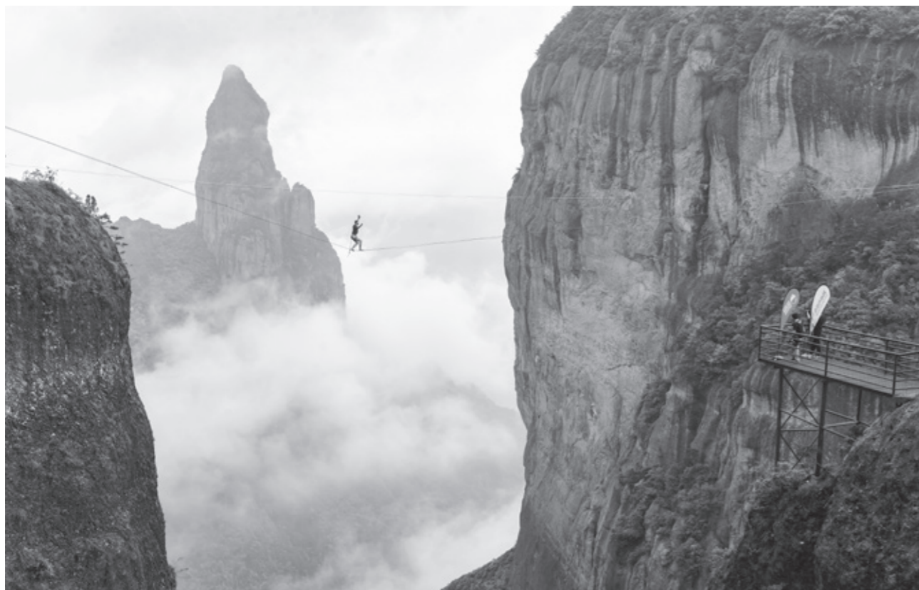
高空扁带

办的“神仙居全球高空扁带挑战赛”，已经来到了第三届。本届赛事规模继续扩大，在选手的质量与数量上达到三届以来的顶峰，共有来自英国、法国、德国、美国、加拿大、瑞士、捷克、奥地利、巴西、中国10个国家的16位全球顶尖选手参赛。本届赛事也将在前两届赛事的基础上升级成为全球最顶级的高空扁带挑战赛事。其中汇集了前世界纪录保持者与现世界纪录保持者、世界扁带第一人与中国扁带第一人等真正的精英豪杰们。