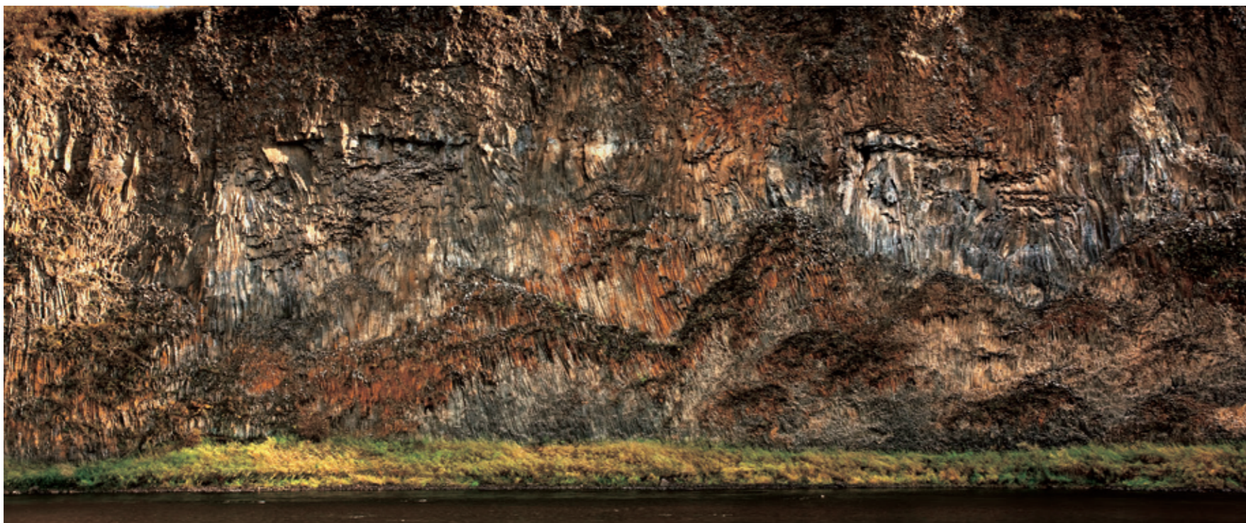
山水岩壁画·风之画笔