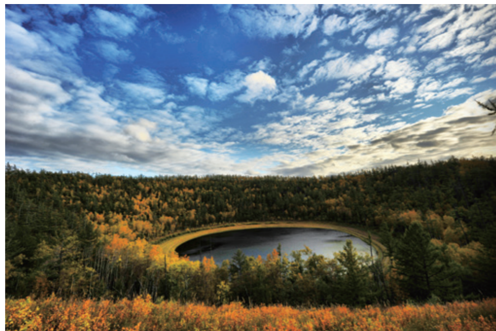
月亮湖秋色