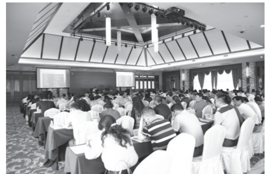
重庆市风景名胜区保护管理培训班授课现场

在住建部、重庆市园林局、合川区政府、合川钓鱼城风景名胜区管理局以及所有组织、参加培训的全体人员的共同努力下，中国风景名胜区协会组织承办的“重庆市风景名胜区保护管理培训班”顺利完成了各项培训课程，获得了良好的预期效果，取得了圆满成功。