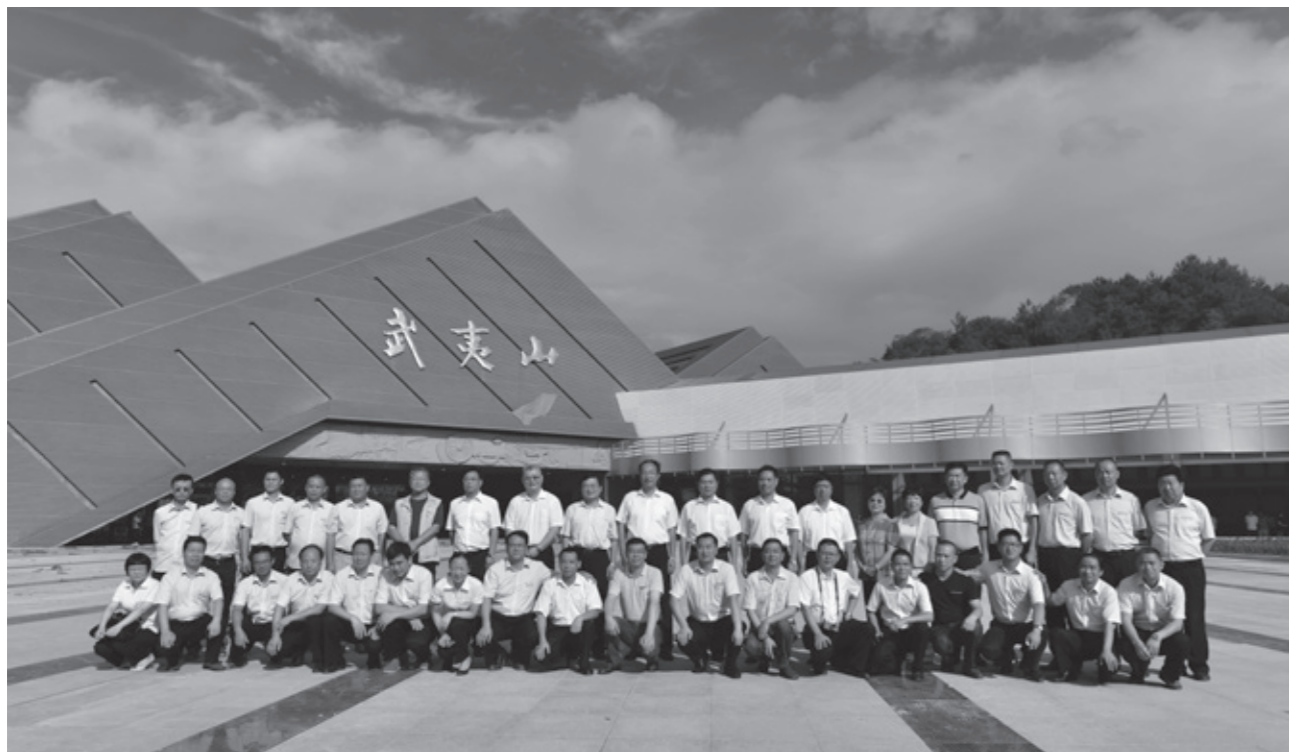
9月29日市领导及嘉宾共同为南入口游客服务中心揭幕并与景区工作人员合影（摄影\陈美中）

设、天游阁修缮提升等系列重点项目建设；围绕创新发展、打造亮点，深入推进武夷宫仿宋古街业态调整、春秋馆改造提升等系列工作；主动对接市场、拓展领域，积极推进武夷山旅游工艺品的开发、营销；加快转型升级、整改提档，做好上游森林公园、青龙瀑布等项目的改造提升，不断完善旅游服务硬软件设施，主动适应新常态，推动景区向前发展。