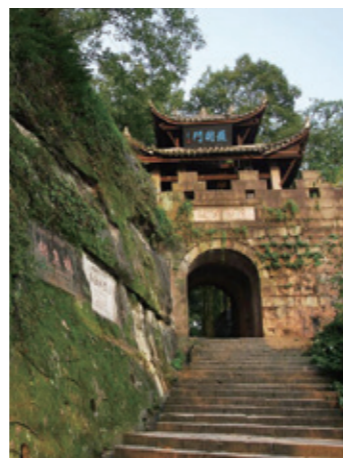
《重庆钓鱼台·护国门》