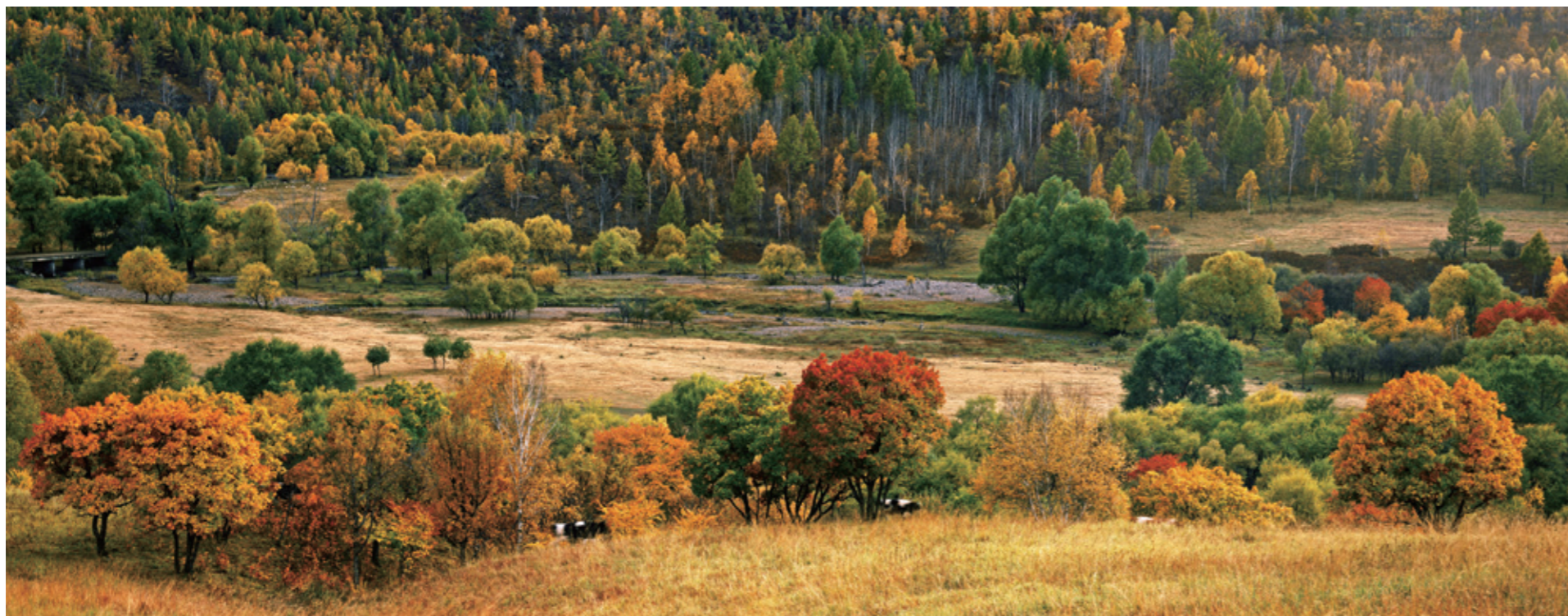
柴河原始森林

他们在清风飘拂之中尽情泼墨、赋彩或勾勒、点染，在微云卷舒之中小镇特有的精致、悠闲与惬意。特别是一位又一位绘画大师前来考察写生基地时，发现这里的奇山异水，正是他们