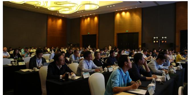
第六届中国风景名胜区道教名山联盟工作会议现场