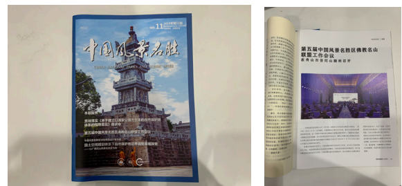
《中国风景名胜区》第五届佛教名山联盟工作会议专刊