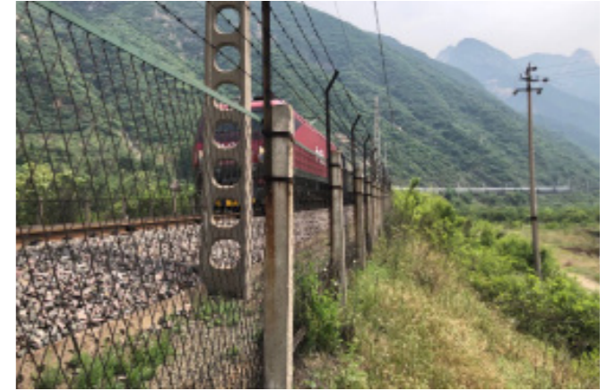
华山南部山脚下陇海线

此次考察交流，加强了协会与华山之间的沟通交流，华山管委会表示未来将借力协会搭建的行业平台，与协会